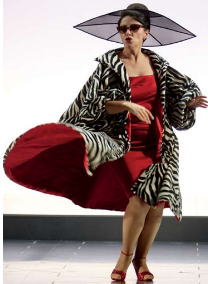
L'italiana in Algeri

En un caso de este tipo pienso que haría algo diferente a lo que se pudiera imaginar, como comisionar una ópera nueva, reestablecer antiguas prácticas que puedan producir sangre nueva, nuevos movimientos y nuevos pensamientos, justo como sucedía en el tiempo de nuestros mayores operistas. Sería estupendo volver a escribir para el teatro pensando en el tipo del cantante-actor,