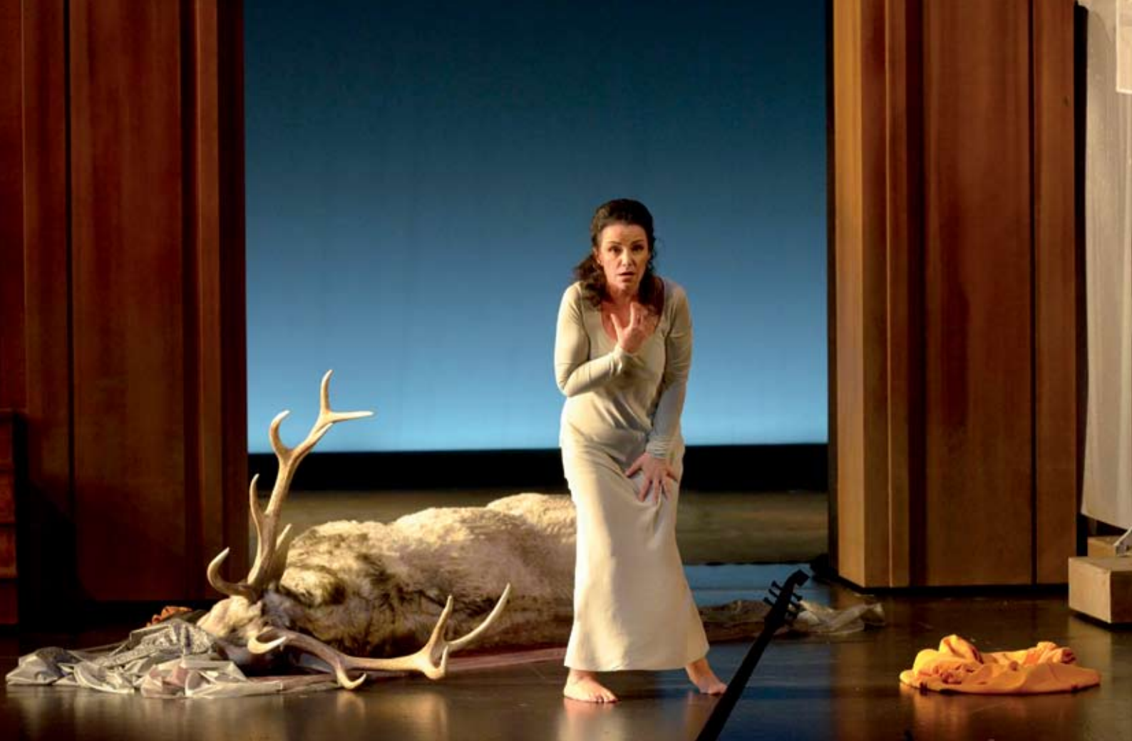
La Didone de Francesco Cavalli en Caen

Mi encuentro con el barroco ha sido en cierto sentido una fortuna porque me ha permitido cuidar mucho el aspecto técnico sin tener que forzar nunca la voz, equiparándome al mismo tiempo con los grandes papeles escritos para los castrados. Esto ha hecho que cada vez que asumo el estudio de un papel ágil, o atlético, como los de las óperas de Händel, puedo acercarme a encontrar el color y la intensidad de la voz de los castrados, mas allá de su perfecta técnica.