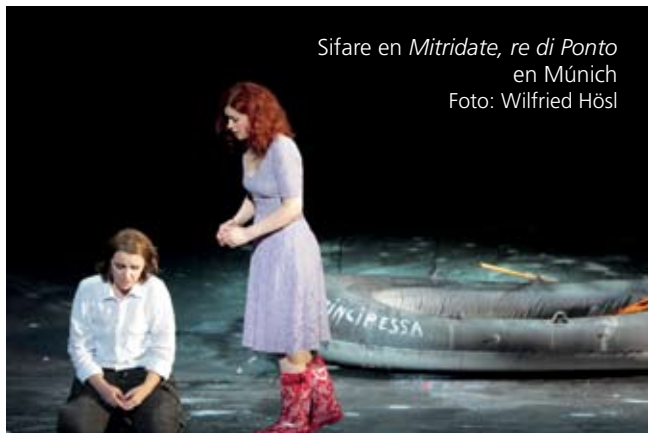
Sifare en Mitridate, re di Ponto en Múnich