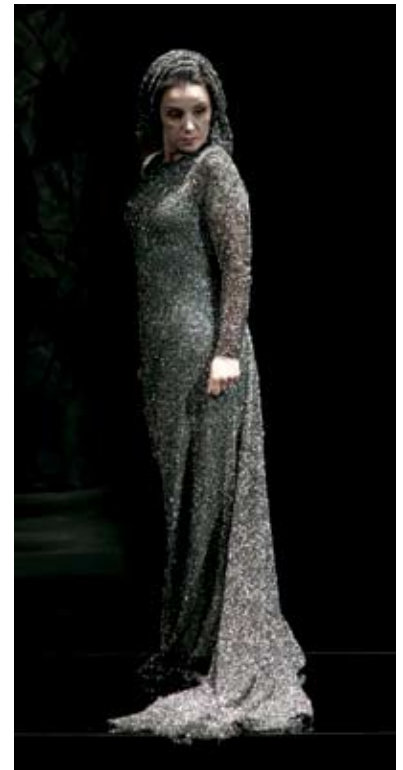
L'incoronazione di Poppea en Madrid

Sin pretender agraviar a nadie, puedo describirme como una “rossiniana fundamentalista”. Obviamente lo digo con la sonrisa con la que me permito esta pequeña licencia, pero al estudiar las composiciones de este grandísimo compositor y su vida rica de eventos notables, estoy convencida de que, de no haber sido por él, muchas obras maestras escritas en años posteriores quizás no existirían, o habrían tomado un camino distinto. La Cenerentola , L'italiana in Algeri ,